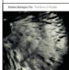
Stefano Battaglia Trio: «The River of Anyder» ECM (Musikkoperatørene)